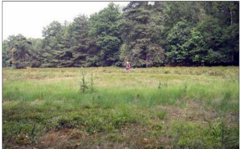
Figuur 1: De grafheuvel waarin de standvoetbeker werd gevonden. In het landschap is de heuvel amper zichtbaar.

Bekers als de standvoetbeker horen niet bij de jagers-verzamelaars. Zij trekken veel rond en kunnen vaak maar weinig meenemen. Een aardewerken pot is groot en de jagers-verzamelaars zullen zulke