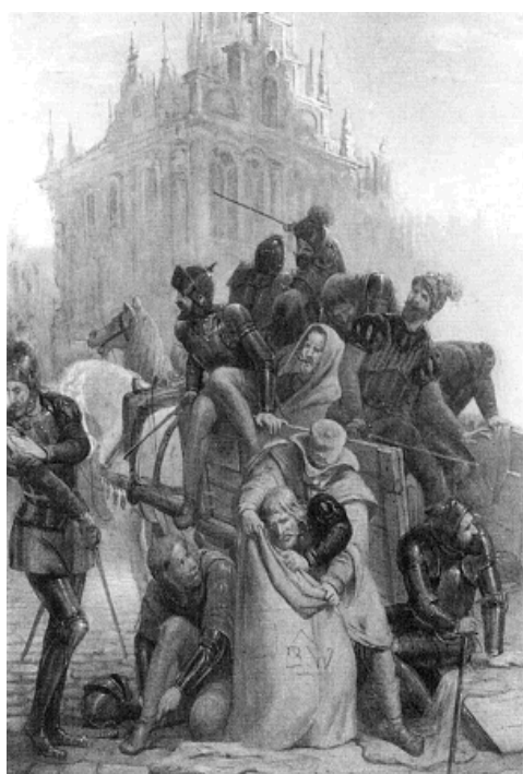
Afbeelding 4: de Gelderse soldaten komen uit de wagen tevoorschijn en overmeesteren Bourgondische soldaten.

Tegenwoordig wordt Maarten nog steeds in Arnhem als een belangrijk persoon gezien. Toch is niet iedereen het daarmee eens. Op andere plekken in Nederland staat Maarten ook wel bekend als een misdadiger. In zijn manier van oorlogsvoeren vindt Maarten het erg belangrijk dat hij zijn doel behaalt, maar heeft hij minder oog voor de manier waarop hij dat doel bereikt. Dat er soms onschuldige slachtoffers vallen, is voor Maarten niet zo'n probleem. Zo verovert hij in 1527 Utrecht en trekt vanuit daar door naar Den Haag. Hij geeft hier