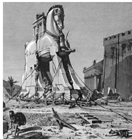
Afbeelding 3: Het Paard van Troje voor de stadsmuren.

Het Paard van Troje is een verhaal uit de Oudheid waarin de Oude Grieken de stad Troje al jaren probeerden te veroveren. Iedere keer bleek de stad toch te sterk en mislukte de Griekse aanval. Daarop bedachten de Grieken een sluwe list. Ze bouwden een heel groot houten paard op wielen en verstopten in de buik van het paard tientallen soldaten (afbeelding 3). Het paard werd in de nacht stiekem naar Troje gereden. In de ochtend ontdekte de stadsbewoners het paard en dachten dat het een geschenk van de goden was. Ze reden het paard naar binnen en vierden een groot feest om de goden te bedanken. Toen het eenmaal weer nacht werd en iedereen sliep, ging er echter een luikje open en kropen de Griekse soldaten uit het paard. Zij konden toen met weinig moeite de slapende soldaten overmeesteren en de poorten van de stad openen, zodat het hele Griekse leger binnen kon stormen.