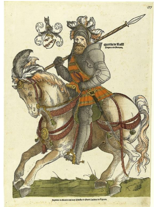
Afbeelding 1: tekening van Maarten van Rossum in een harnas op een paard.

Maarten van Rossum (afbeelding 1) wordt waarschijnlijk rond 1490 geboren in Zaltbommel en hij is de zoon van adellijke ouders. Zijn vader heeft veel land in bezit en is heer van verschillende Gelderse dorpen en steden. Daardoor zijn de Van Rossums erg bekend bij de hertog van Gelre. Hoe Maarten zijn jeugd doorbrengt is niet bekend, maar doordat zijn ouders zulke rijke edelen zijn, moet hij wel een goede opleiding hebben gehad. Hij zal les hebben gehad in Latijn, wiskunde en in krijgskunde. In dat laatste vak wordt geleerd hoe je oorlog moet voeren en welke tactieken op welke moment goed van pas komen.