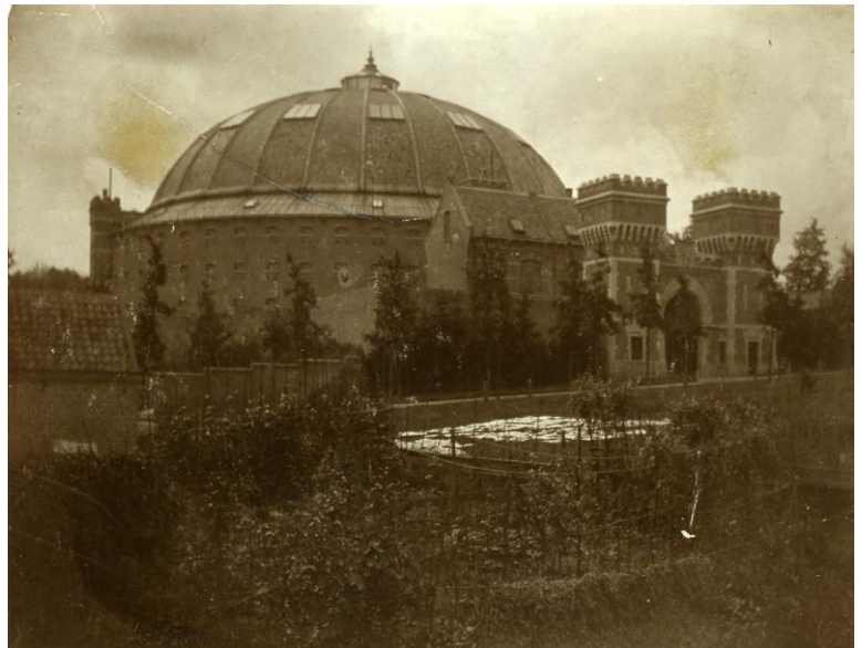
Figuur 1: Foto van de koepelgevangenis uit 1905. Bij de twee torens was de toegangspoort van de gevangenis.