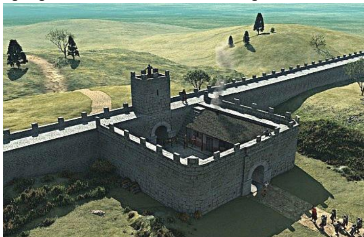
Afbeelding 2: Zo zou de muur van Hadrianus er op veel plekken uit hebben gezien.

Als nieuwe gebieden ingelijfd werden in het Romeinse Rijk, moesten ze goed verdedigd worden. Vijanden aan de andere kant wilden vaak maar wat graag de Romeinen dwarszitten of hun gebieden terugveroveren. Om vijanden op tijd te kunnen opmerken en om ze daarna ook zo snel mogelijk tegen te kunnen houden, bouwden de Romeinen flink wat verdedigingswerken. In Groot-Britannië werd er bijvoorbeeld de muur van Hadrianus (afbeelding 2) gebouwd. Dit was een muur die van het westen naar het oosten van Engeland liep, ter hoogte van de huidige stad Newcastle. De muur was grotendeels opgebouwd uit steen en was op sommige stukken wel 4,5 meter hoog en gemiddeld 3 meter dik. Bij de muur werden nog eens 16 forten gebouwd, waarin ongeveer 500 soldaten woonden, en tussen de forten werden losse